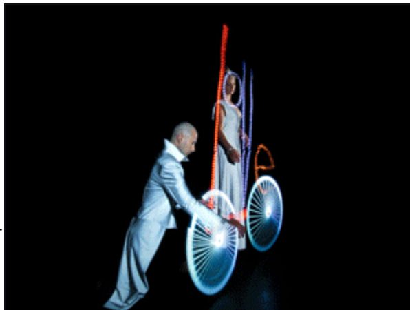
"Love Reflections" - Lightpainting in der Zeitfeld-Matrix

Die entstandenen Kunstwerke können den Besuchern und Kunden in verschiedenen Varianten zur Verfügung gestellt werden. z.B. per Download, eingebettet auf Webseiten, auch für mobile Endgeräte, auf USB-Sticks und Sie können vor Ort als interaktive Animations-Installation direkt betrachtet werden.