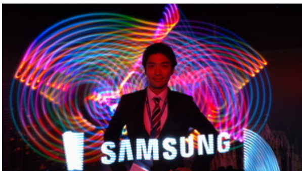
Lightpainting Fotostation Photokina 2012 für Samsung