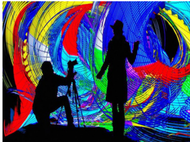
Video-Lightpainting-Station - Festival of Lights Berlin

Die entstehenden Lichtkunstwerke können als Give-Away mitgenommen werden (Analog als Ausdruck oder digital) oder z.B. beim Event auf Bildschirmen oder in Projektionen gezeigt werden.