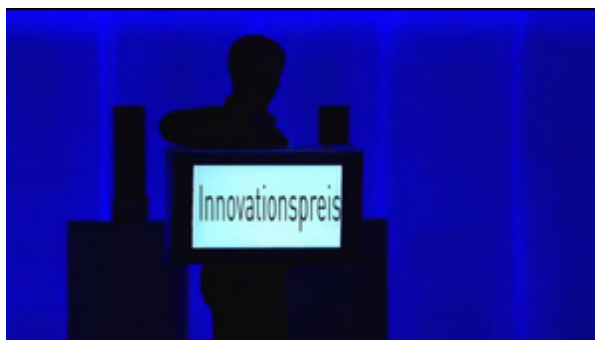
Video-Koffer Opening zur LED-Show - Innovationspreis-Verleihung