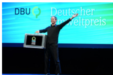
Video-Koffer-Intro bei Umweltpreis 2016