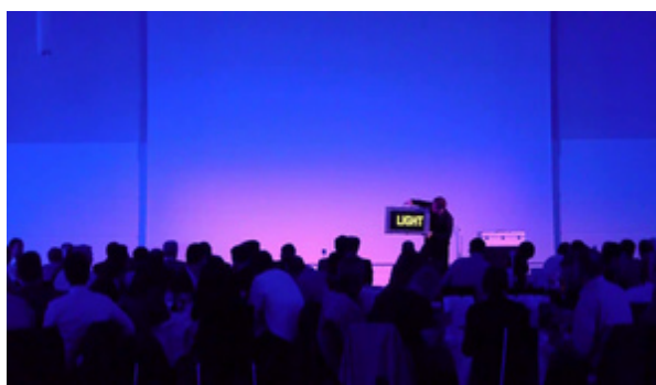
Video-Koffer Opening zur Video-Lightpainting-Show bei OSRAM Illuminating Days