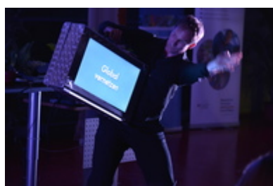
Slogans im Video-Koffer bei DFG-Event