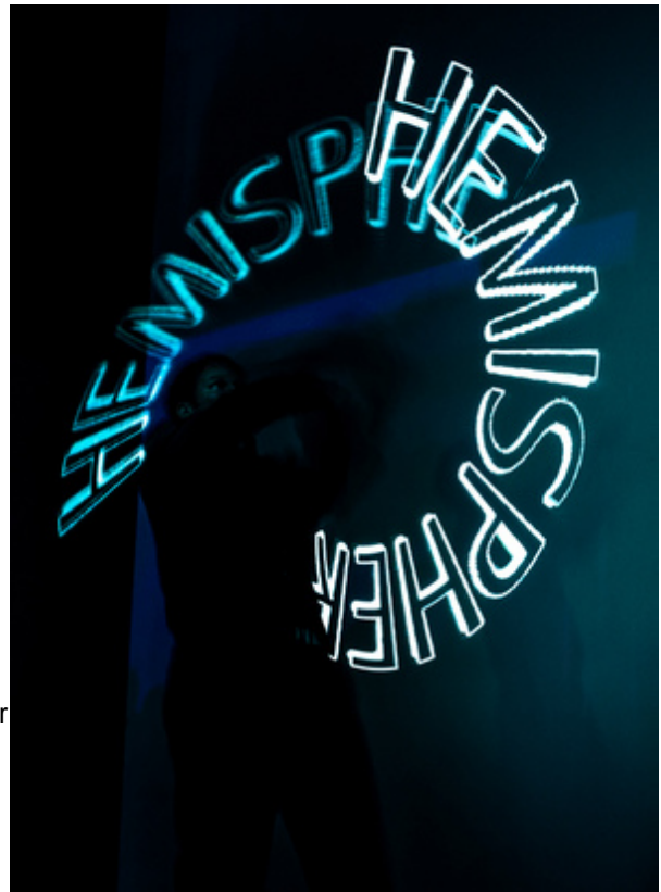
GRAFIK-TOYS Text-/Logo-Jonglage Till Pöhlmann

Die Grafik-Toys lassen sich auch hervorragend in den neuen Live-Lightpainting -Shows und Stationen einsetzen, hier bleiben die geschriebenen/ gemalten Schlagworte, Produkte und Logos zusätzlich zum Erscheinen in der Luft auch auf der Leinwand oder in den langzeitbelichteten Fotos stehen.