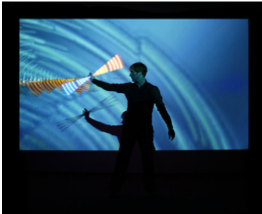
Licht-Jonglage in LightPainting-Show

Die Leucht-Jonglage kann auch mit anderen Künsten zu kombinierten Shows verbunden werden. Unter Anderem mit den weiteren Acts von Till Pöhlmann