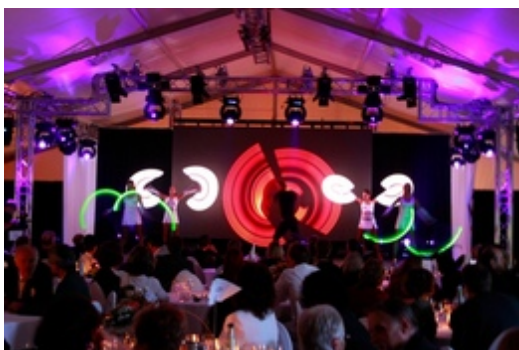
LED-Jonglage in Kooperation mit SANOSTRA

Till Pöhlmanns Spezialgebiet: Auftragsarbeiten mit Licht-Jonglage