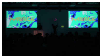
Lightpainting Show mit Eventinhalten