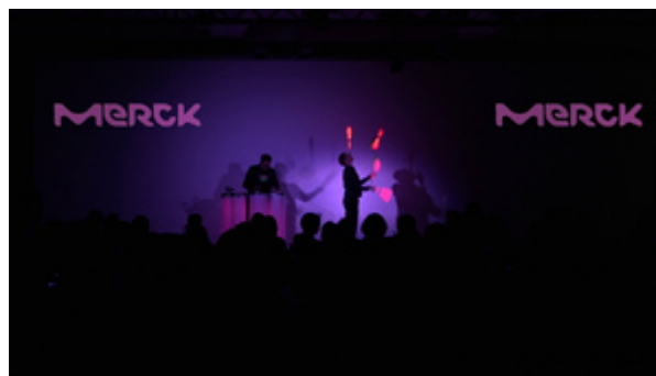
LED-Trommel-Lichtjonglage-Show für MERCK

In einer 15 Minütigen Show mit LED-Jonglage und live LED-Perkussion sowie einem fulminanten Abschluss mit Live-Video-Lightpainting wurde das neue Logo sowie die Elemente der neuen farbenfrohen CI präsentiert.