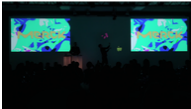
Lightpainting Show mit Eventinhalten