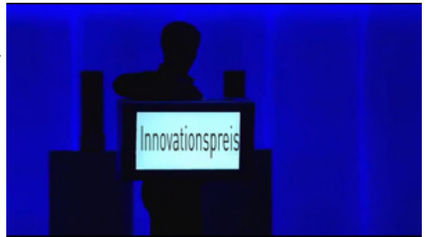
Video-Koffer Opening zur LED-Show - Innovationspreis-Verleihung