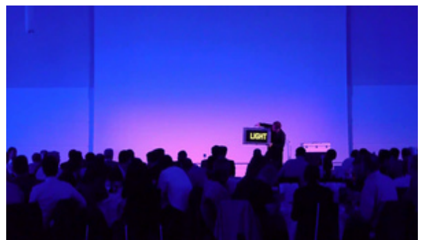
Video-Koffer Opening zur Video-Lightpainting-Show bei OSRAM Illuminating Days