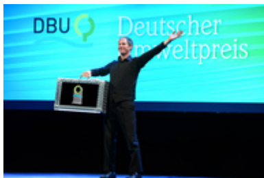
Video-Koffer-Intro bei Umweltpreis 2016