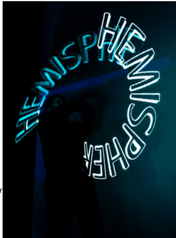
GRAFIK-TOYS Text-/Logo-Jonglage Till Pöhlmann

Die Grafik-Toys lassen sich auch hervorragend in den neuen Live-Lightpainting -Shows und Stationen einsetzen, hier bleiben die geschriebenen/ gemalten Schlagworte, Produkte und Logos zusätzlich zum Erscheinen in der Luft auch auf der Leinwand oder in den langzeitbelichteten Fotos stehen.