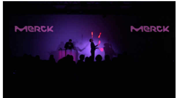
LED-Trommel-Lichtjonglage-Show für MERCK

In einer 15 Minütigen Show mit LED-Jonglage und live LED-Perkussion sowie einem fulminanten Abschluss mit Live-Video-Lightpainting wurde das neue Logo sowie die Elemente der neuen farbenfrohen CI präsentiert.