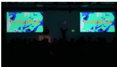
Lightpainting Show mit Eventinhalten