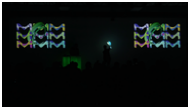
MERCK-Logo präsentiert in der live Lightpainting-Show